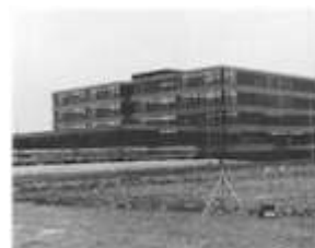
Das fertige, noch kahle Schulhaus

Ab 1970 ergaben sich nicht zuletzt auf Grund der oben geschilderten dezentralen Strukturen, die zu Begegnungsorten ausserhalb der Schulzimmer führten (z. B. Pausen in Gasthäusern), intensive Gespräche mit dem Aargauischen Wirtverband, der für die Ausbildung seines Nachwuchses gleiche Raumprobleme zu lösen hatte wie das Baugewerbe. Im gleichen Jahr beschlossen die beiden Verbände gemeinsam ein eigenes Gebäude zu erstellen. Der Aargauische Baumeisterverband, der Schweizerische Baumeisterverband, der Aargauische Zimmermeisterverband, der Aargauische Wirtverband und der Kanton Aargau beteiligten sich an der Stiftung, die ein Bauvorhaben dieser Grössenordnung zuliess. Da in Aarau kein geeigneter Baugrund gefunden werden konnte, entschloss man sich zur Realisierung des Projektes in Unterentfelden.