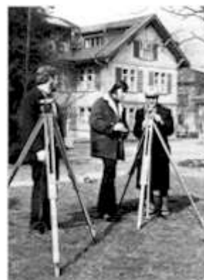
Bauschüler beim Vermessen