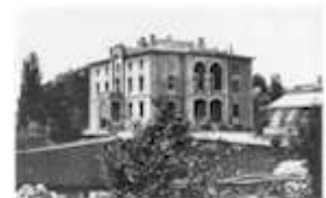
Die Villa Feer 1880

Bis 1895 / 96 wurden je ein Schulgebäude für die Kantonsschule (heute Alte Kantonsschule) und für das Gewerbemuseum erstellt; die bestehende Villa Feer wurde in den Baukörper des Gewerbemuseums integriert. Die ursprünglich konzipierte Anlage wurde allerdings erheblich reduziert. Immerhin konnte nun die gewerbliche Bildung, die bis anhin an verschiedenen Orten seit 1820 mehrheitlich in Form von Kursen stattgefunden hatte, konzentriert werden.