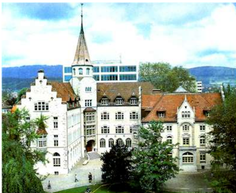
Kantonale Schule für Berufsbildung im 1984 - 87 vollständig renovierten Gewerbemuseum

Im Laufe der 20. Jahrhunderts zeigte sich allerdings, dass diese Vielfalt an Bildungsangeboten sowohl räumlich als auch organisatorisch nicht mehr unter dem Dach des Gewerbemuseums zu bewältigen war. Einerseits führten Vorgaben des Gesetzgebers (Berufsbildungsgesetze) zu neuem Raum- und Handlungsbedarf und andererseits drängte ein neues Verständnis über Aufgaben der Öffentlichkeit bezüglich kultureller Förderung / Bildung auf die Verselbständigung der Sammlungen.