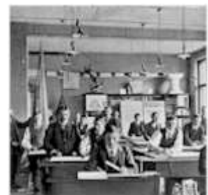
Die Bauschule um 1905

1906 wurde die Abteilung als Fachschule für Bautechnik bezeichnet. Dem Vorwissen der Absolventen angepasst, wurden die Lehrinhalte nun in einer unteren und einer oberen Klasse vermittelt. Die stetige Zunahme der Studentenzahlen in den folgenden Jahren führte zu erschwerten Eintrittsbedingungen: Ab 1925 wurden nur noch Absolventen mit einem Lehrabschluss als Maurer oder Zimmermann, die eine Aufnahmeprüfung abgelegt hatten, unterrichtet. So konnte die Zahl der Schüler in den Jahren vor dem Zweiten Weltkrieg auf rund 100 beschränkt werden, eine Notwendigkeit, da keine geeigneten Räume zur Verfügung standen.