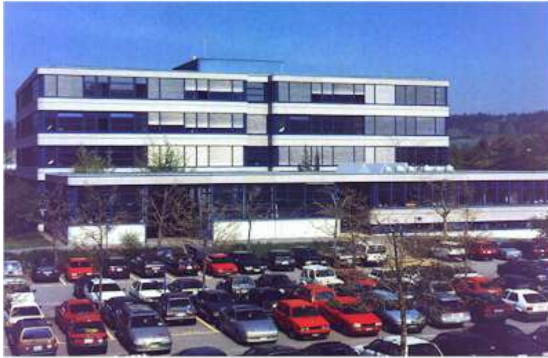
Schweizerische Bauschule Aarau mit Labortrakt im Bildungszentrum Untereffelden

1978 konnte das Schulhaus nach zweijähriger Bauzeit bezogen werden. Die Kosten beliefen sich auf rund 20 Mio Franken. Die Bezirksschule Entfelden war bis zum Einzug in ein eigenes Schulhaus Mieterin des ersten Obergeschosses; ab 1986 bis 1988 belegte die Firma Sprecher & Schuh zwei Räume.